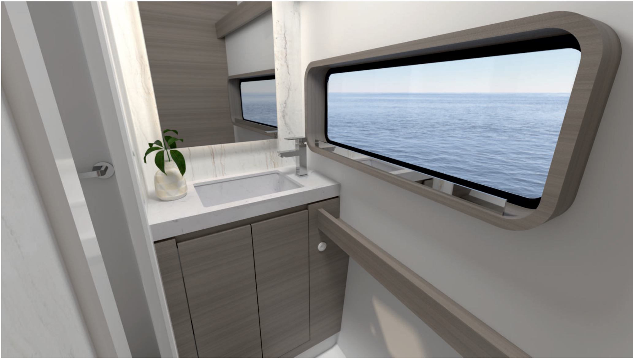
Salle de bain invités / Guest bathroom