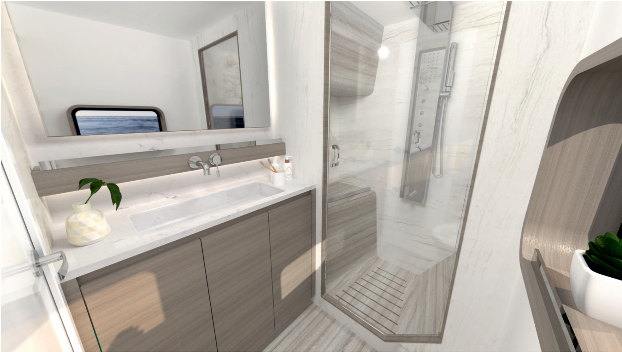
Salle de bain propriétaire / Owner's bathroom