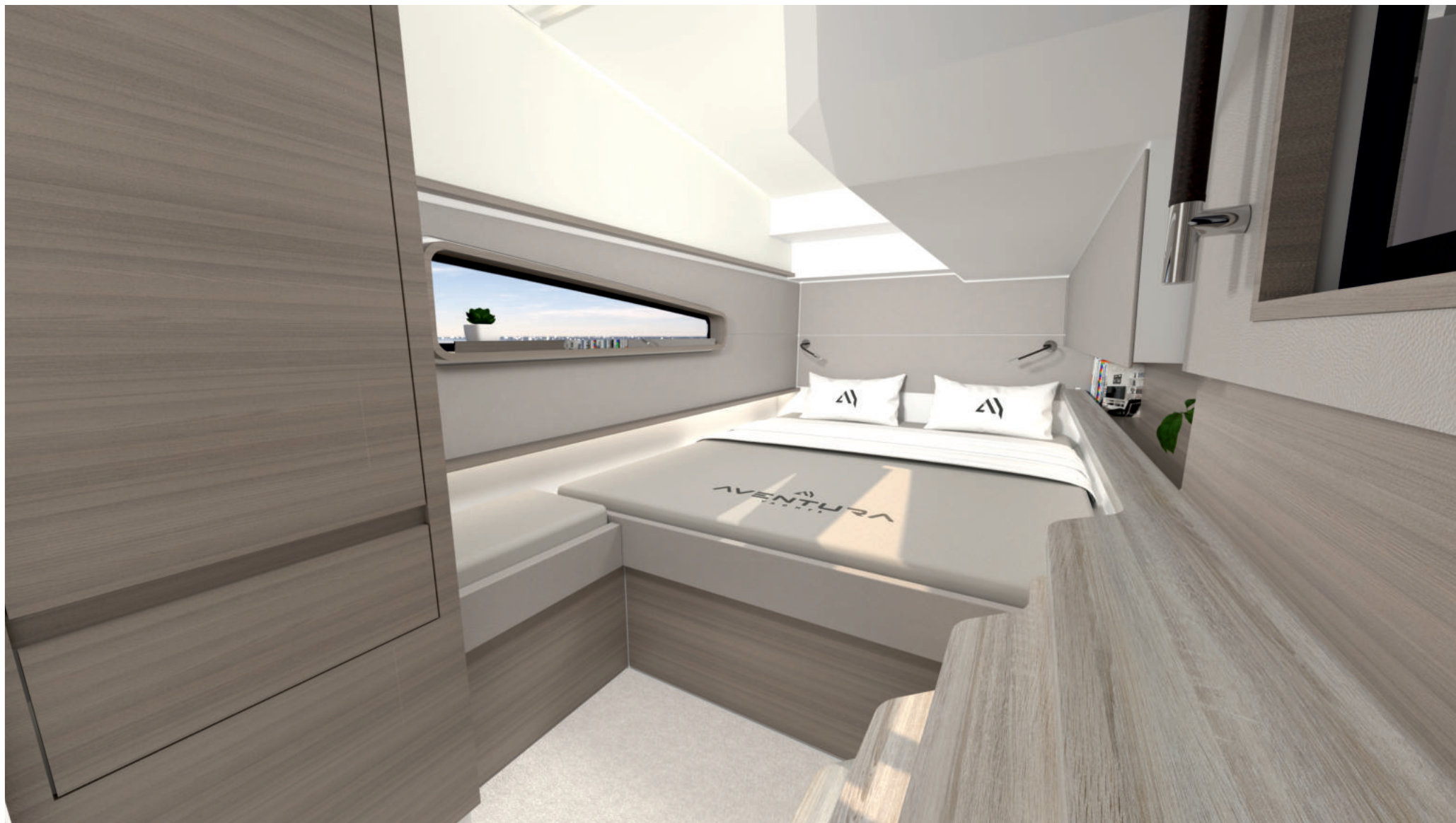
Cabine propriétaire / Owner's cabin