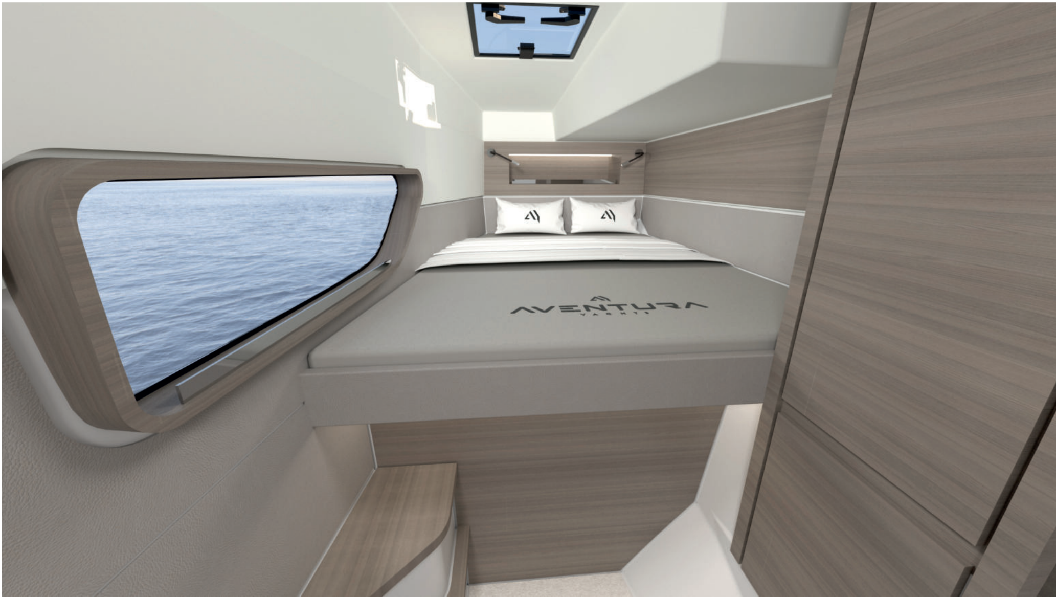
Cabine invités / Guest cabin