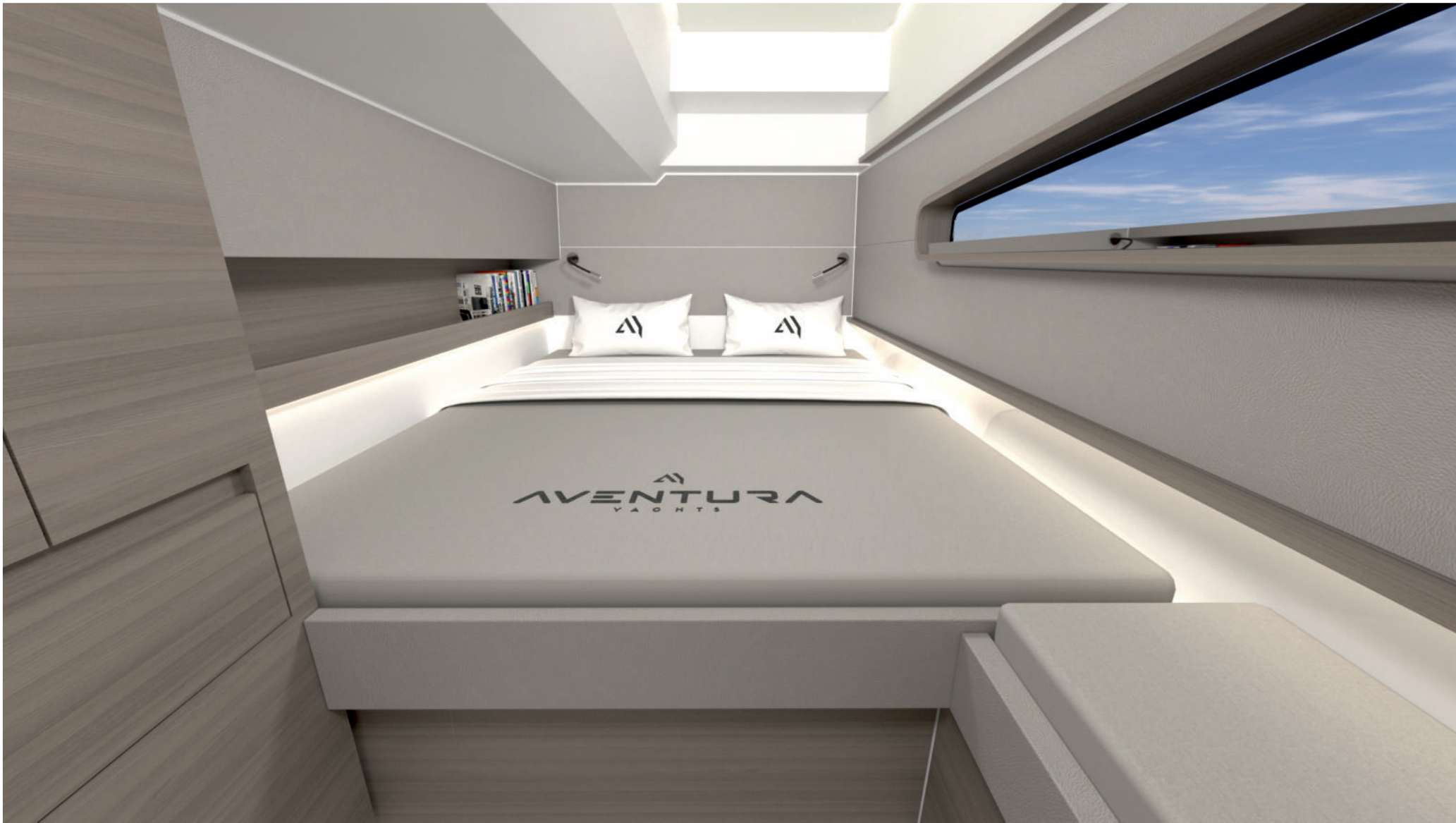
Cabine invités / Guest cabin